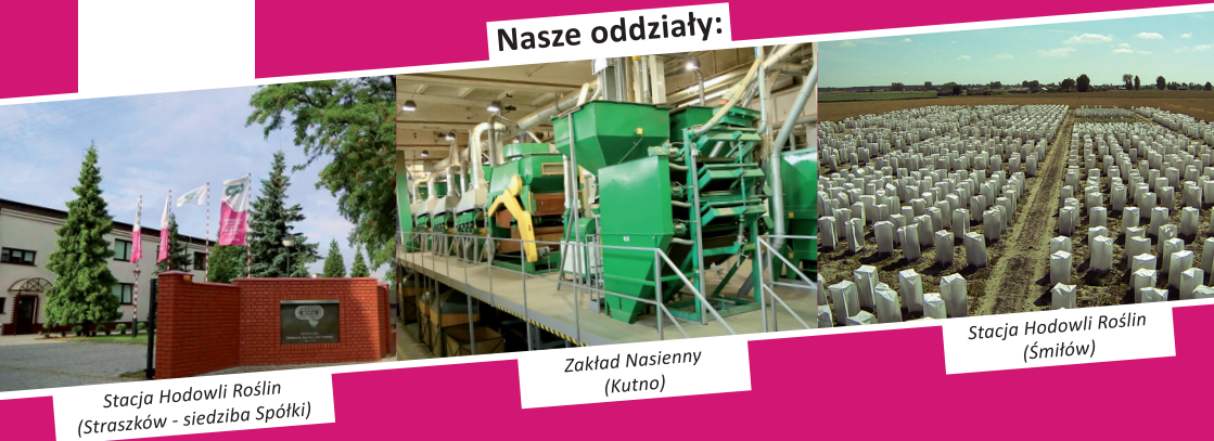
Stacja Hodowli Roślin (Straszów - siedziba Spółki)